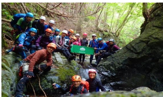
2017年の公開沢登り教室（奥多摩 水根沢）

マスキ嵐沢は西丹沢らしく明るい沢で、ナメもあり登れる小滝が連続する初心者向けの楽しい沢です。それでも緊張しそうな滝は勿論、ロープで確保します。いつもの登山道を離れて、沢登りの世界へちょっと冒険してみませんか。